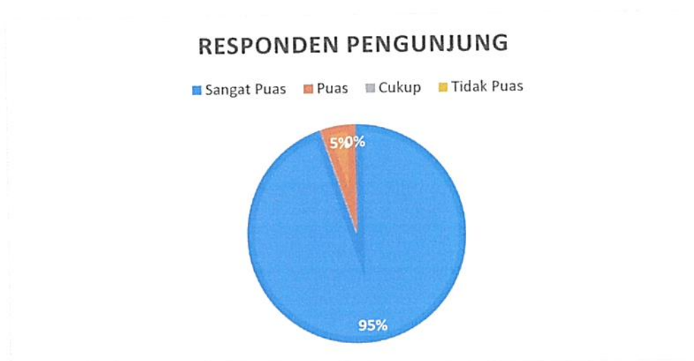
Diagram Indeks Kepuasan Masyarakat (IKM)

Bahwa berdasarkan grafik dan diagram sebagaimana tersebut di atas dapat diketahui tingkat Kepuasan Masyarakat pada Pengadilan Negeri / PHI / Tipikor Serang Kelas IA cukup memuaskan dikarenakan dari seluruh pengguna yang mendatangi Pengadilan Negeri / PHI / Tipikor Serang Kelas IA untuk mendapatkan pelayanan hukum sebanyak total jumlah responden pengguna 77 (tujuh puluh tujuh) orang, jumlah responden yang merasa sangat puas sebanyak 73 (tujuh puluh tiga) orang, Puas 4 (empat) orang, Kurang Puas sebanyak 0 (nol) orang dan tidak puas tidak ada dengan perolehan persentase jumlah responden pengguna yang merasa sangat puas dengan pelayanan hukum Pengadilan Negeri / PHI / Tipikor Serang Kelas IA sebesar 95% (sembilan puluh lima) persen.