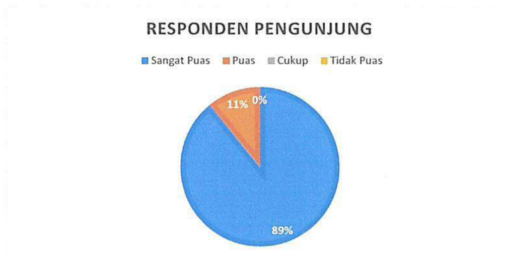
Diagram Indeks Kepuasan Masyarakat (IKM)

Bahwa berdasarkan grafik dan diagram sebagaimana tersebut di atas dapat diketahui tingkat Kepuasan Masyarakat pada Pengadilan Negeri / PHI / Tipikor Serang Kelas IA cukup memuaskan dikarenakan dari seluruh pengguna yang mendatangi Pengadilan Negeri / PHI / Tipikor Serang Kelas IA untuk mendapatkan pelayanan hukum sebanyak total jumlah responden pengguna 120 (serratus dua puluh) orang, jumlah responden yang merasa sangat puas sebanyak 107 (serratus tujuh) orang, Puas 13 (tiga belas) orang, Kurang Puas sebanyak 0 (nol) orang dan tidak puas tidak ada dengan perolehan persentase jumlah responden pengguna yang merasa sangat puas dengan pelayanan hukum Pengadilan Negeri / PHI / Tipikor Serang Kelas IA sebesar 89% (delapan puluh sembilan) persen.