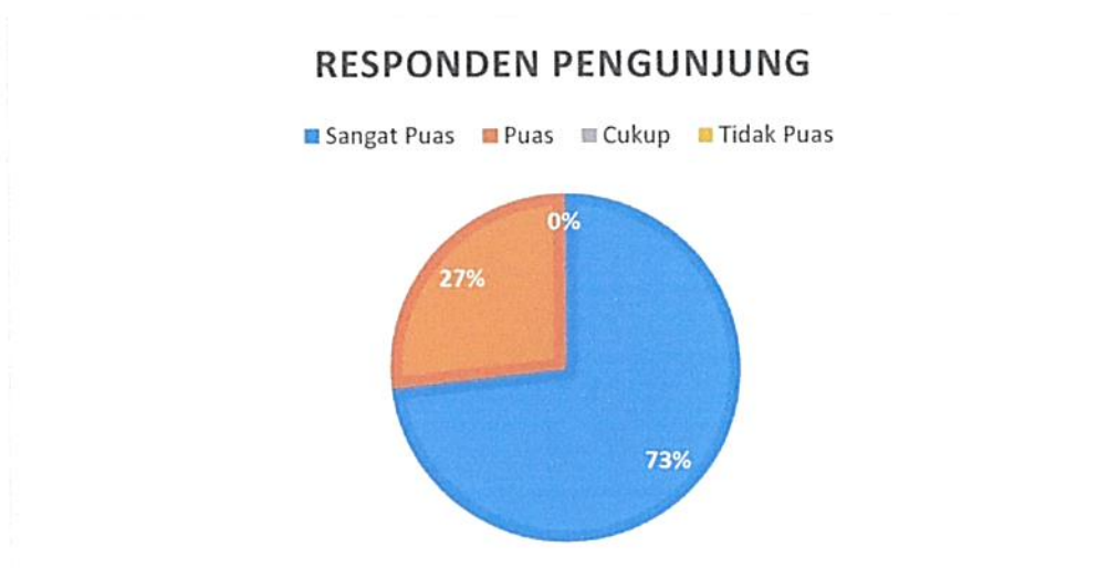
Diagram Indeks Kepuasan Masyarakat (IKM)

Bahwa berdasarkan grafik dan diagram sebagaimana tersebut di atas dapat diketahui tingkat Kepuasan Masyarakat pada Pengadilan Negeri / PHI / Tipikor Serang Kelas IA cukup memuaskan dikarenakan dari seluruh pengguna yang mendatangi Pengadilan Negeri / PHI / Tipikor Serang Kelas IA untuk mendapatkan pelayanan hukum sebanyak total jumlah responden pengguna 112 (seratus dua belas) orang, jumlah responden yang merasa sangat puas sebanyak 82 (delapan puluh dua) orang, Puas 30 (tiga puluh) orang, Kurang Puas sebanyak 0 (nol) orang dan tidak puas tidak ada dengan perolehan persentase jumlah responden pengguna yang merasa sangat puas dengan pelayanan hukum Pengadilan Negeri / PHI / Tipikor Serang Kelas IA sebesar 73% (tujuh puluh tiga) persen.