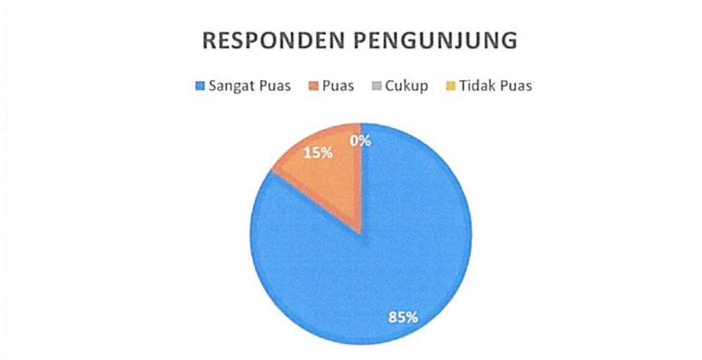
Diagram Indeks Kepuasan Masyarakat (IKM)

Bahwa berdasarkan grafik dan diagram sebagaimana tersebut di atas dapat diketahui tingkat Kepuasan Masyarakat pada Pengadilan Negeri / PHI / Tipikor Serang Kelas IA cukup memuaskan dikarenakan dari seluruh pengguna yang mendatangi Pengadilan Negeri / PHI / Tipikor Serang Kelas IA untuk mendapatkan pelayanan hukum sebanyak total jumlah responden pengguna 113 (seratus tiga belas) orang, jumlah responden yang merasa sangat puas sebanyak 96 (sembilan puluh enam) orang, Puas 17 (tujuh belas) orang, Kurang Puas sebanyak 0 (nol) orang dan tidak puas tidak ada dengan perolehan persentase jumlah responden pengguna yang merasa sangat puas dengan pelayanan hukum Pengadilan Negeri / PHI / Tipikor Serang Kelas IA sebesar 85% (tujuh puluh enam) persen.