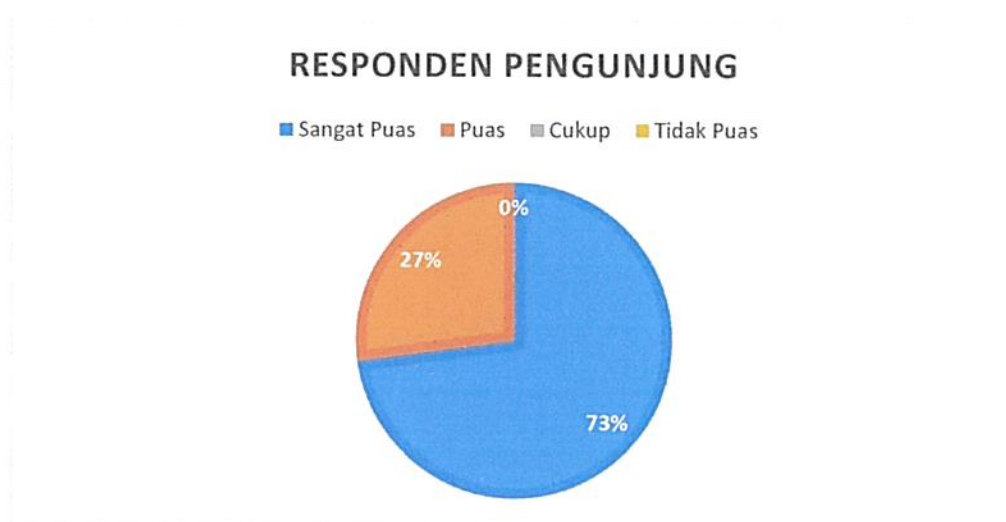
Diagram Indeks Kepuasan Masyarakat (IKM)

Bahwa berdasarkan grafik dan diagram sebagaimana tersebut di atas dapat diketahui tingkat Kepuasan Masyarakat pada Pengadilan Negeri / PHI / Tipikor Serang Kelas IA cukup memuaskan dikarenakan dari seluruh pengguna yang mendatangi Pengadilan Negeri / PHI / Tipikor Serang Kelas IA untuk mendapatkan pelayanan hukum sebanyak total jumlah responden pengguna 107 (seratus tujuh) orang, jumlah responden yang merasa sangat puas sebanyak 78 (tujuh puluh delapan) orang, Puas 29 (dua puluh sembilan) orang, Kurang Puas sebanyak 0 (nol) orang dan tidak puas tidak ada dengan perolehan persentase jumlah responden pengguna yang merasa sangat puas dengan pelayanan hukum Pengadilan Negeri / PHI / Tipikor Serang Kelas IA sebesar 73% (tujuh puluh tiga) persen.