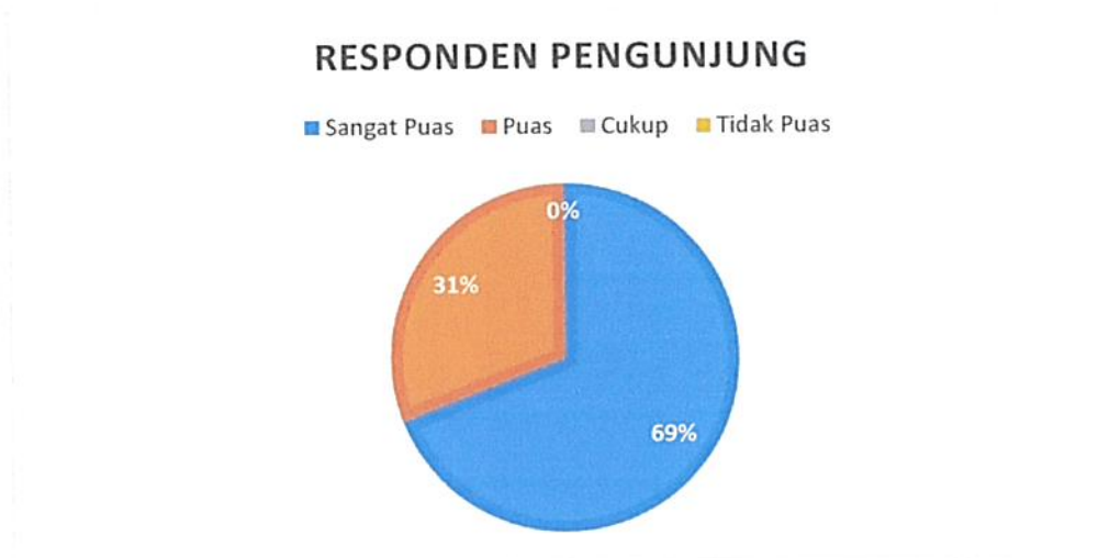
Diagram Indeks Kepuasan Masyarakat (IKM)

Bahwa berdasarkan grafik dan diagram sebagaimana tersebut di atas dapat diketahui tingkat Kepuasan Masyarakat pada Pengadilan Negeri / PHI / Tipikor Serang Kelas IA cukup memuaskan dikarenakan dari seluruh pengguna yang mendatangi Pengadilan Negeri / PHI / Tipikor Serang Kelas IA untuk mendapatkan pelayanan hukum sebanyak total jumlah responden pengguna 82 (delapan puluh dua) orang, jumlah responden yang merasa sangat puas sebanyak 65 (enam puluh lima) orang, Puas 17 (tujuh belas) orang, Kurang Puas sebanyak 0 (nol) orang dan tidak puas tidak ada dengan perolehan persentase jumlah responden pengguna yang merasa sangat puas dengan pelayanan hukum Pengadilan Negeri / PHI / Tipikor Serang Kelas IA sebesar 69% (enam puluh sembilan) persen.