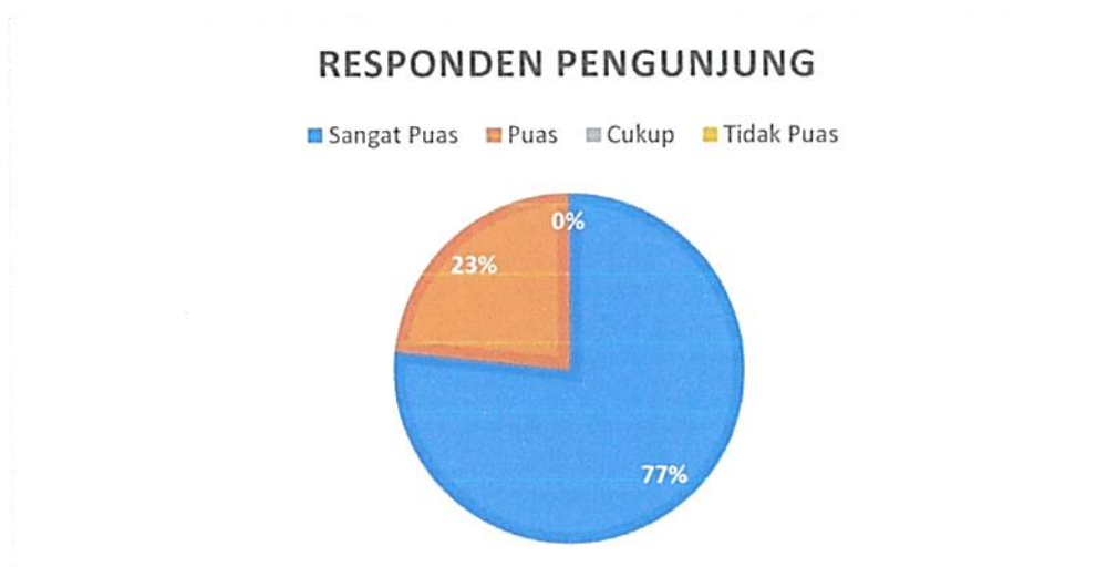
Diagram Indeks Kepuasan Masyarakat (IKM)

Bahwa berdasarkan grafik dan diagram sebagaimana tersebut di atas dapat diketahui tingkat Kepuasan Masyarakat pada Pengadilan Negeri / PHI / Tipikor Serang Kelas IA cukup memuaskan dikarenakan dari seluruh pengguna yang mendatangi Pengadilan Negeri / PHI / Tipikor Serang Kelas IA untuk mendapatkan pelayanan hukum sebanyak total jumlah responden pengguna 103 (seratus tiga) orang, jumlah responden yang merasa sangat puas sebanyak 79 (tujuh puluh sembilan) orang, Puas 24 (dua puluh empat) orang, Kurang Puas sebanyak 0 (nol) orang dan tidak puas tidak ada dengan perolehan persentase jumlah responden pengguna yang merasa sangat puas dengan pelayanan hukum Pengadilan Negeri / PHI / Tipikor Serang Kelas IA sebesar 77% (tujuh puluh tujuh) persen.