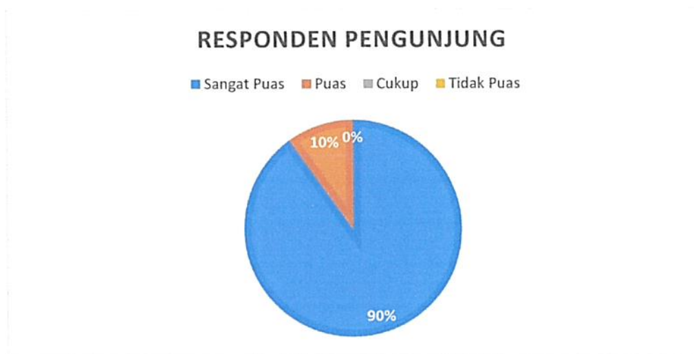
Diagram Indeks Kepuasan Masyarakat (IKM)

Bahwa berdasarkan grafik dan diagram sebagaimana tersebut di atas dapat diketahui tingkat Kepuasan Masyarakat pada Pengadilan Negeri / PHI / Tipikor Serang Kelas IA cukup memuaskan dikarenakan dari seluruh pengguna yang mendatangi Pengadilan Negeri / PHI / Tipikor Serang Kelas IA untuk mendapatkan pelayanan hukum sebanyak total jumlah responden pengguna 91 (sembilan puluh satu) orang, jumlah responden yang merasa sangat puas sebanyak 82 (delapan puluh dua) orang, Puas 9 (sembilan) orang, Kurang Puas sebanyak 0 (nol) orang dan tidak puas tidak ada dengan perolehan persentase jumlah responden pengguna yang merasa sangat puas dengan pelayanan hukum Pengadilan Negeri / PHI / Tipikor Serang Kelas IA sebesar 90% (sembilan puluh) persen.