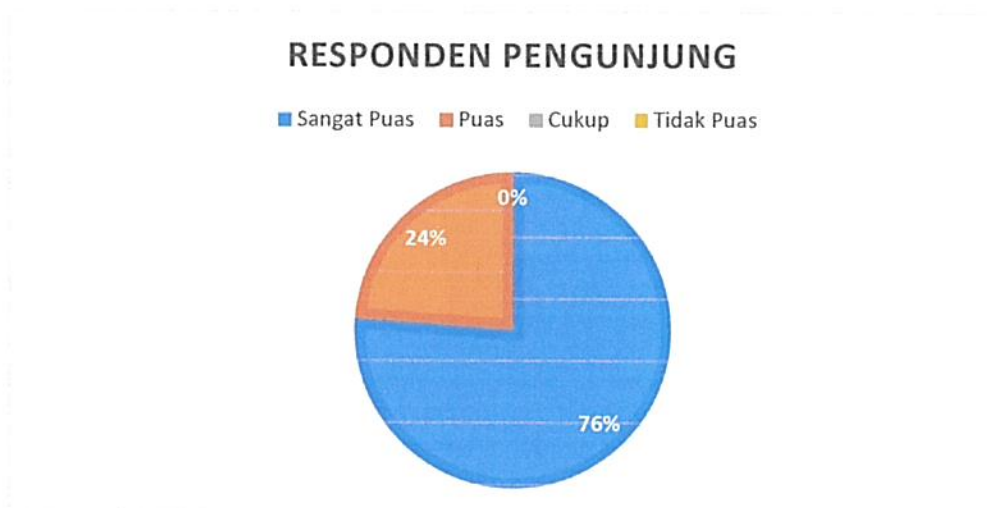
Diagram Indeks Kepuasan Masyarakat (IKM)

Bahwa berdasarkan grafik dan diagram sebagaimana tersebut di atas dapat diketahui tingkat Kepuasan Masyarakat pada Pengadilan Negeri / PHI / Tipikor Serang Kelas IA cukup memuaskan dikarenakan dari seluruh pengguna yang mendatangi Pengadilan Negeri / PHI / Tipikor Serang Kelas IA untuk mendapatkan pelayanan hukum sebanyak total jumlah responden pengguna 88 (delapan puluh delapan) orang, jumlah responden yang merasa sangat puas sebanyak 67 (enam puluh tujuh) orang, Puas 21 (dua puluh satu) orang, Kurang Puas sebanyak 0 (nol) orang dan tidak puas tidak ada dengan perolehan persentase jumlah responden pengguna yang merasa sangat puas dengan pelayanan hukum Pengadilan Negeri / PHI / Tipikor Serang Kelas IA sebesar 76% (tujuh puluh enam) persen.