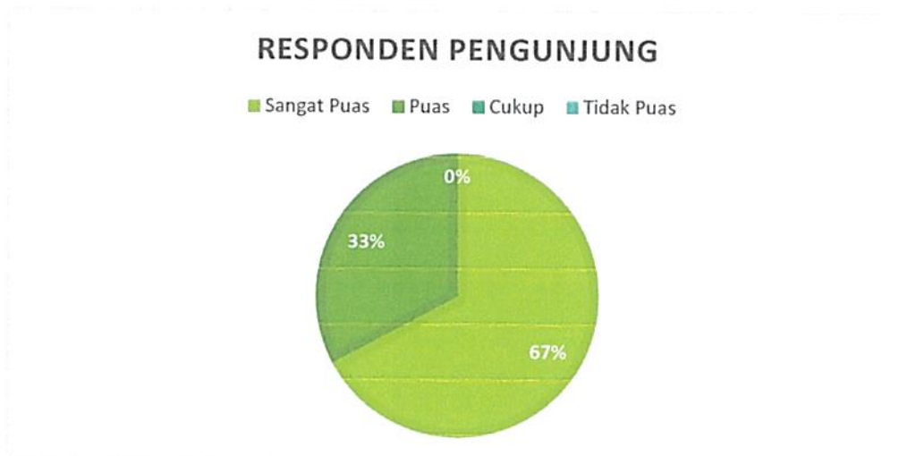
Diagram Indeks Kepuasan Masyarakat (IKM)

Bahwa berdasarkan grafik dan diagram sebagaimana tersebut di atas dapat diketahui tingkat Kepuasan Masyarakat pada Pengadilan Negeri / PHI / Tipikor Serang Kelas IA cukup memuaskan dikarenakan dari seluruh pengguna yang mendatangi Pengadilan Negeri / PHI / Tipikor Serang Kelas IA untuk mendapatkan pelayanan hukum sebanyak total jumlah responden pengguna 137 (seratus tiga puluh tujuh) orang, jumlah responden yang merasa sangat puas sebanyak 92 (Sembilan puluh dua) orang, Puas 45 (dua puluh satu) orang, Kurang Puas sebanyak 0 (nol) orang dan tidak puas tidak ada dengan perolehan persentase jumlah responden pengguna yang merasa sangat puas dengan pelayanan hukum Pengadilan Negeri / PHI / Tipikor Serang Kelas IA sebesar 67% (tujuh puluh enam) persen.