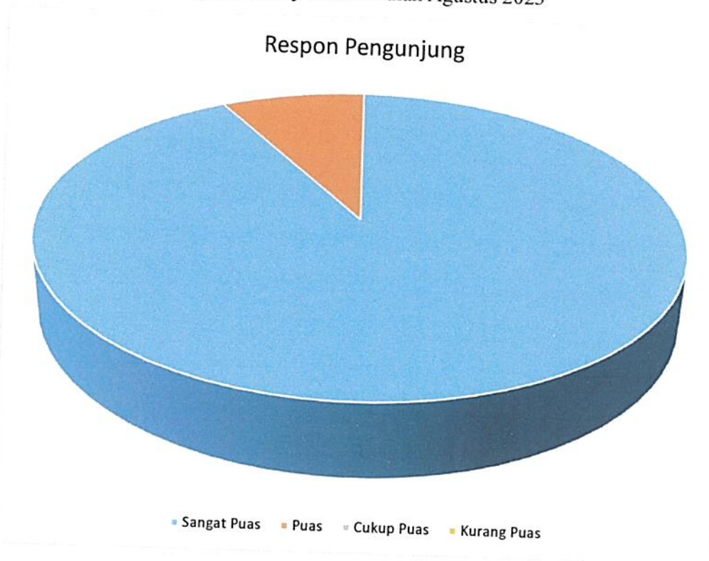
Diagram Survey Harian Bulan Agustus 2023

Bahwa berdasarkan grafik dan diagram sebagaimana tersebut di atas dapat diketahui tingkat Kepuasan Masyarakat pada Pengadilan Negeri / PHI / Tipikor Serang Kelas IA dalam kategori memuaskan dikarenakan dari seluruh responden pelayanan Pengadilan Negeri / PHI / Tipikor Serang Kelas IA total sebanyak 180 (seratus delapan puluh) responden, jumlah responden yang merasa sangat puas sebanyak 165 (seratus enam puluh lima) orang, puas 15 (lima belas) orang, kurang puas 0 (kosong) dan tidak puas sebanyak 0 (kosong) dengan perolehan persentase jumlah responden pengguna yang merasa sangat puas dengan pelayanan hukum Pengadilan Negeri / PHI / Tipikor Serang Kelas IA sebesar 91% (sembilan puluh satu) persen. Perbandingan data responden pada bulan Juli 2023 (80% dalam 255 responden) mengalami kenaikan dalam jumlah responden dan pada tingkat kepuasan pelayanan. Dalam pelaksanaannya mengalami beberapa kendala diantaranya kurang berpartisipasi pengguna layanan dalam mengisi survey. Dengan kenaikan tersebut diharapkan dapat dipertahankan pelayanannya kepada semua petugas pelayanan PTSP pada Pengadilan Negeri Serang Kelas IA.