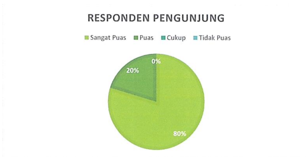
Diagram Indeks Kepuasan Masyarakat (IKM)

Bahwa berdasarkan grafik dan diagram sebagaimana tersebut di atas dapat diketahui tingkat Kepuasan Masyarakat pada Pengadilan Negeri / PHI / Tipikor Serang Kelas IA cukup memuaskan dikarenakan dari seluruh pengguna yang mendatangi Pengadilan Negeri / PHI / Tipikor Serang Kelas IA untuk mendapatkan pelayanan hukum sebanyak total jumlah responden pengguna 123 (seratus dua puluh tiga) orang, jumlah responden yang merasa sangat puas sebanyak 98 (sembilan puluh delapan) orang, Puas 25 (dua puluh lima) orang, Kurang Puas sebanyak 0 (nol) orang dan tidak puas tidak ada dengan perolehan persentase jumlah responden pengguna yang merasa sangat puas dengan pelayanan hukum Pengadilan Negeri / PHI / Tipikor Serang Kelas IA sebesar 80% (tujuh puluh enam) persen.