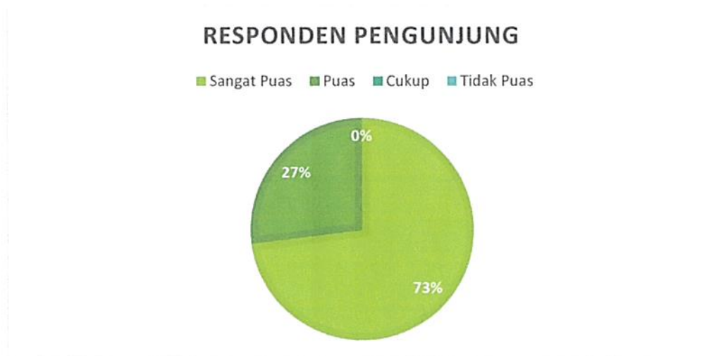
Diagram Indeks Kepuasan Masyarakat (IKM)

Bahwa berdasarkan grafik dan diagram sebagaimana tersebut di atas dapat diketahui tingkat Kepuasan Masyarakat pada Pengadilan Negeri / PHI / Tipikor Serang Kelas IA cukup memuaskan dikarenakan dari seluruh pengguna yang mendatangi Pengadilan Negeri / PHI / Tipikor Serang Kelas IA untuk mendapatkan pelayanan hukum sebanyak total jumlah responden pengguna 63 (enam puluh tiga) orang, jumlah responden yang merasa sangat puas sebanyak 46 (empat puluh enam) orang, Puas 17 (tujuh belas) orang, Kurang Puas sebanyak 0 (nol) orang dan tidak puas tidak ada dengan perolehan persentase jumlah responden pengguna yang merasa sangat puas dengan pelayanan hukum Pengadilan Negeri / PHI / Tipikor Serang Kelas IA sebesar 73% (tujuh puluh tiga) persen.