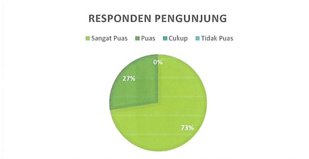
Diagram Indeks Kepuasan Masyarakat (IKM)

Bahwa berdasarkan grafik dan diagram sebagaimana tersebut di atas dapat diketahui tingkat Kepuasan Masyarakat pada Pengadilan Negeri / PHI / Tipikor Serang Kelas IA cukup memuaskan dikarenakan dari seluruh pengguna yang mendatangi Pengadilan Negeri / PHI / Tipikor Serang Kelas IA untuk mendapatkan pelayanan hukum sebanyak total jumlah responden pengguna 51 (lima puluh satu) orang, jumlah responden yang merasa sangat puas sebanyak 37 (tiga puluh tujuh) orang, Puas 14 (empat belas) orang, Kurang Puas sebanyak 0 (nol) orang dan tidak puas tidak ada dengan perolehan persentase jumlah responden pengguna yang merasa sangat puas dengan pelayanan hukum Pengadilan Negeri / PHI / Tipikor Serang Kelas IA sebesar 73% (tujuh puluh tiga) persen.