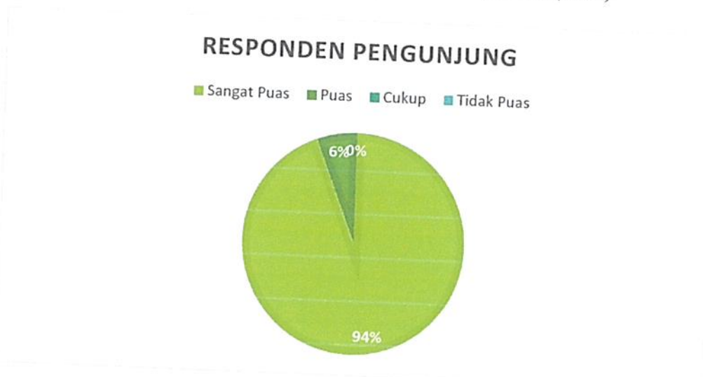
Diagram Indeks Kepuasan Masyarakat (IKM)

Bahwa berdasarkan grafik dan diagram sebagaimana tersebut di atas dapat diketahui tingkat Kepuasan Masyarakat pada Pengadilan Negeri / PHI / Tipikor Serang Kelas IA cukup memuaskan dikarenakan dari seluruh pengguna yang mendatangi Pengadilan Negeri / PHI / Tipikor Serang Kelas IA untuk mendapatkan pelayanan hukum sebanyak total jumlah responden pengguna 221 (Dua Ratus Dua Puluh Satu) orang, jumlah responden yang merasa sangat puas sebanyak 208 (Dua Ratus Delapan) orang, Puas 13 (Tiga Belas) orang, Kurang Puas sebanyak 0 (nol) orang dan tidak puas tidak ada dengan perolehan persentase jumlah responden pengguna yang merasa sangat puas dengan pelayanan hukum Pengadilan Negeri / PHI / Tipikor Serang Kelas IA sebesar 94% (Sembilan Puluh Empat) persen.