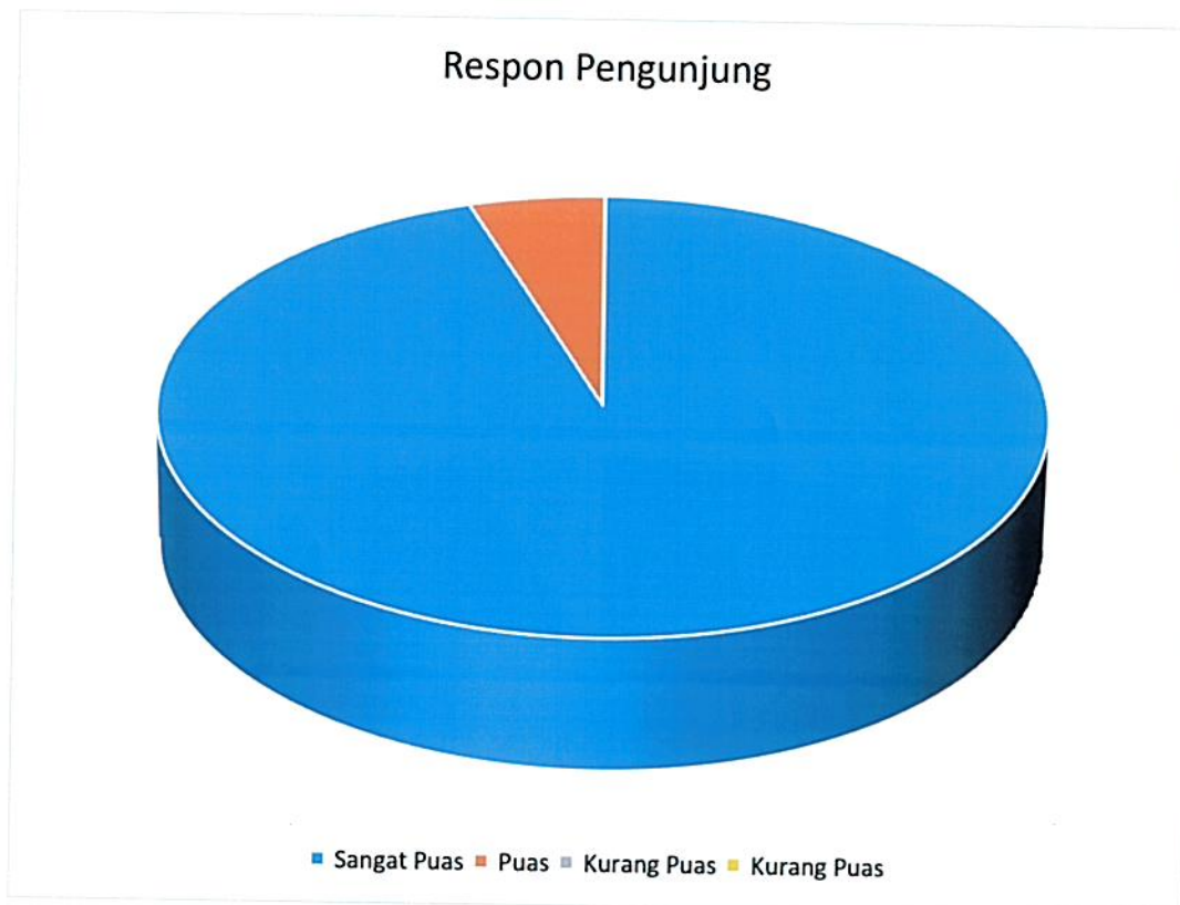
Diagram Survey Harian Bulan April 2024

Bahwa berdasarkan grafik dan diagram sebagaimana tersebut di atas dapat diketahui tingkat Kepuasan Masyarakat pada Pengadilan Negeri / PHI / Tipikor Serang Kelas IA dalam kategori memuaskan dikarenakan dari seluruh responden pelayanan Pengadilan Negeri / PHI / Tipikor Serang Kelas IA total sebanyak 96 (sembilan puluh enam) responden, jumlah responden yang merasa sangat puas sebanyak 91 (sembilan puluh satu) orang, puas 5 (lima) orang, kurang puas 0 (kosong) dan tidak puas sebanyak 0 (kosong) dengan perolehan